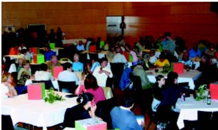
Zur Präsentation des Sozialprofiles in Mäder kamen rund 200 BürgerInnen.

kann erstmals von einer wirklichen BürgerInnenbeteiligung gesprochen werden. Rund 120 MädereInnen haben bisher intensiv daran mitgearbeitet. Mit einem Fragebogen mit über 100 Fragen (Rücklauf 66%) wurden die Sichtweise und Wünsche der Bevölkerung zum sozialen Leben in Mäder erhoben. Auf der Basis dieser Auswertung wurden dann die Leitsätze und Maßnahmen zu deren Umsetzung erarbeitet. Jetzt liegt das fertige Sozialprofil vor. Nun geht es an die Umsetzung. In drei Arbeitsgruppen werden die Themen „Kinder-Jugend-Familien“, „Älter werden in Mäder / Senioren- und Sozialzentrum“ und „Miteinander / Lebensqualität, die sich lohnt“ bearbeitet. Ein Teil der Ideen wurde bereits während der Arbeit am Sozialprofil in Angriff genommen. So fand