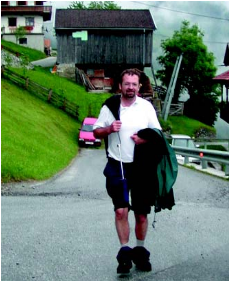
Der Vorsitzende in Brandberg (A)