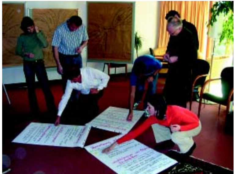
Die BetreuerInnen erarbeiteten im Workshop für die bestehenden Probleme Lösungsansätze.

Abschließend wurde festgestellt, dass ein Austausch in dieser Art regelmäßig erfolgen soll und auch als Basis für die Arbeit im Netzwerk unbedingt notwendig ist.