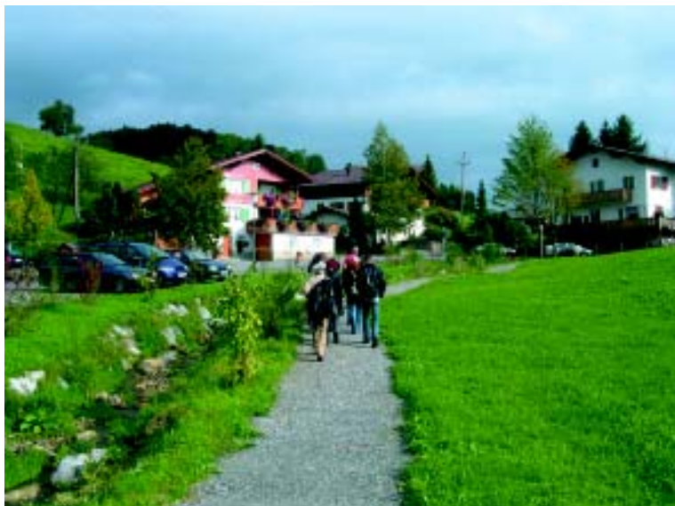
Dieser Rundweg, der entlang eines revitalisierten Baches verläuft, soll über das Thema Energie informieren, wenn er fertig gestaltet ist.