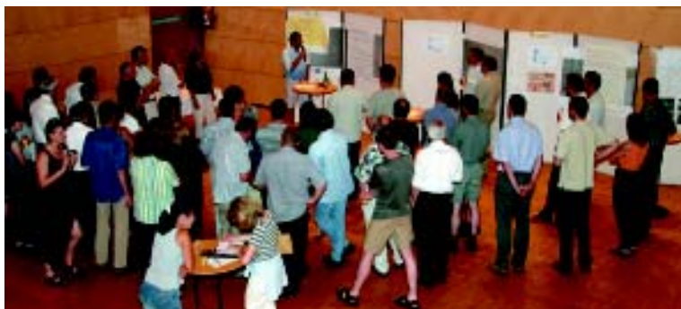
Die Projektteams aller fünf Gemeinden tauschten sich bei Erfahrungstreffen aus.

Red - Die Gemeinden Mäder (A), Frastanz (A), Grabs (CH), Mauren (FL) und Schaan (FL) haben das Interreg IIIA-Projekt „Mikronetz Rheintal – Gemeinden mobil“ abgeschlossen. Am 9. Juli