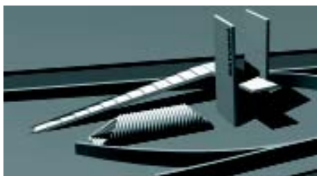
So soll der Info-Punkt Staben in Naturns aussehen.

eingeladen werden. Als erster Schritt werden die Ortseinfahrten besonders attraktiv gestaltet und bequeme Parkierungsmöglichkeiten geschaffen, die TouristInnen und Einheimischen die Möglichkeit bieten, Interessantes über Naturns zu erfahren. Gleichzeitig wird auch innerorts an der