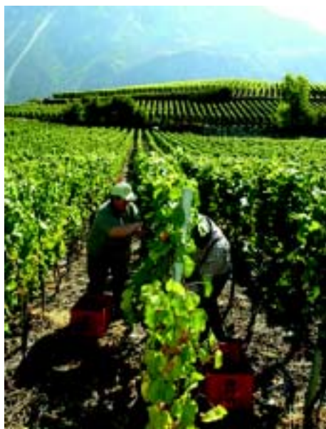
A Salquenen, le vignoble est roi.

Depuis 1996, des vignerons, des artisans et des hôteliers collaborent avec la commune au sein de leur propre association (service de communication) et s'efforcent de mettre en