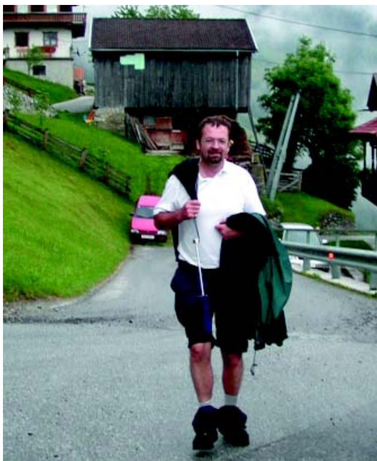
Le président à Brandberg (A)