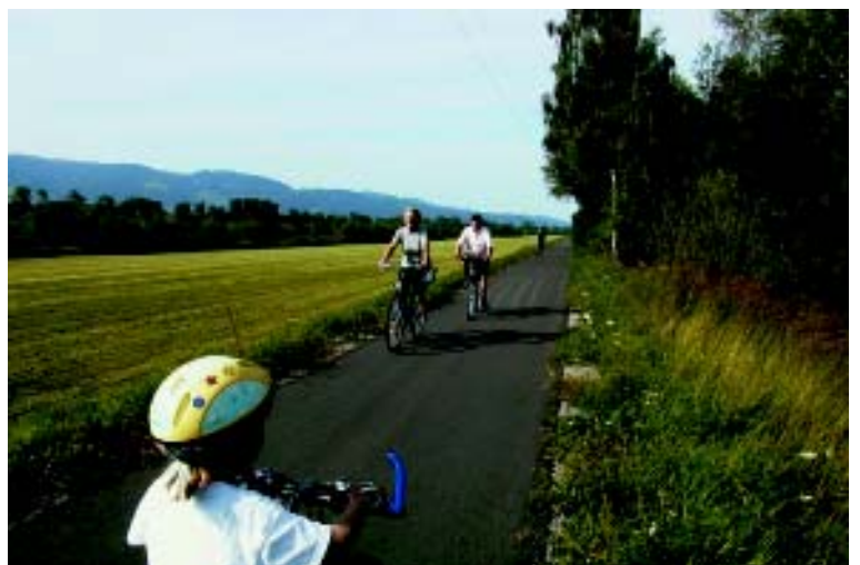
... à la plaine.