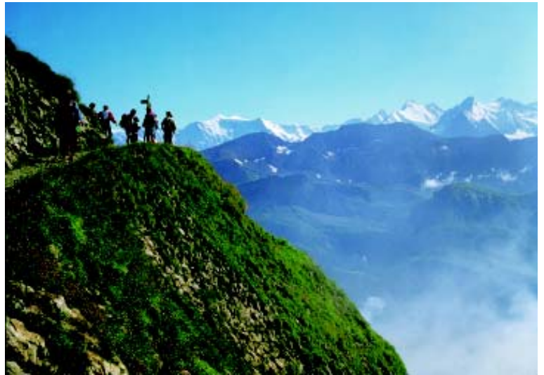
Les Alpes, un espace de vie : de la haute montagne ...

La philosophie et les règles de ce traité sont définies dans une convention cadre ratifiée par toutes les parties contractantes. Des étapes concrètes, des possibilités d'action et de développement ainsi que des mesures de protection sont définies dans les