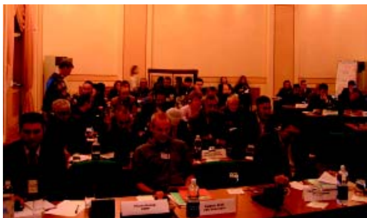
Les membres de l'Alliance des villages de montagne d'Asie centrale organisent, eux aussi, des rencontres régulières pour échanger leurs expériences.