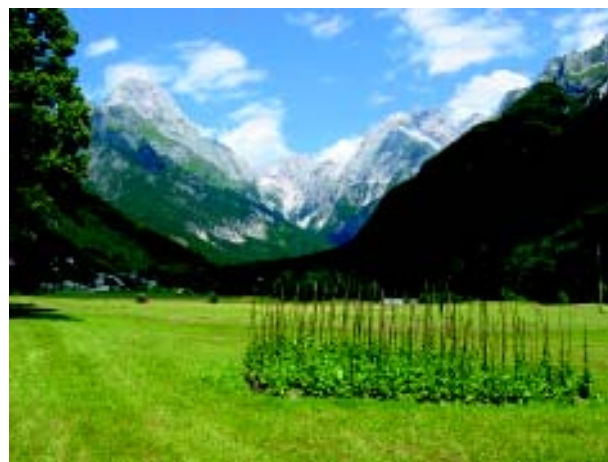
La semaine alpine aura lieu en septembre 2004 en Slovénie .