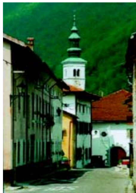
Il Comune di Caporetto

Oggi Caporetto e dintorni sono un apprezzato centro turistico circondato da elevate montagne, che offre numerosi punti di interesse e la possibilità di svolgere escursioni e di praticare caccia e pesca. Percorsi segnalati portano da Caporetto alla vetta di numerose montagne: Stol, Matajur e Krn e alla cascata di Kozjak. Durante l'estate l'acqua stimolante della Nadižna invita a bagni tonificanti. Sulle pendici del Krn, al di sopra di Caporetto, passano i confini del Parco nazionale del Tricorno, un paradiso di indimenticabili bellezze naturali, selvagge e romantiche.