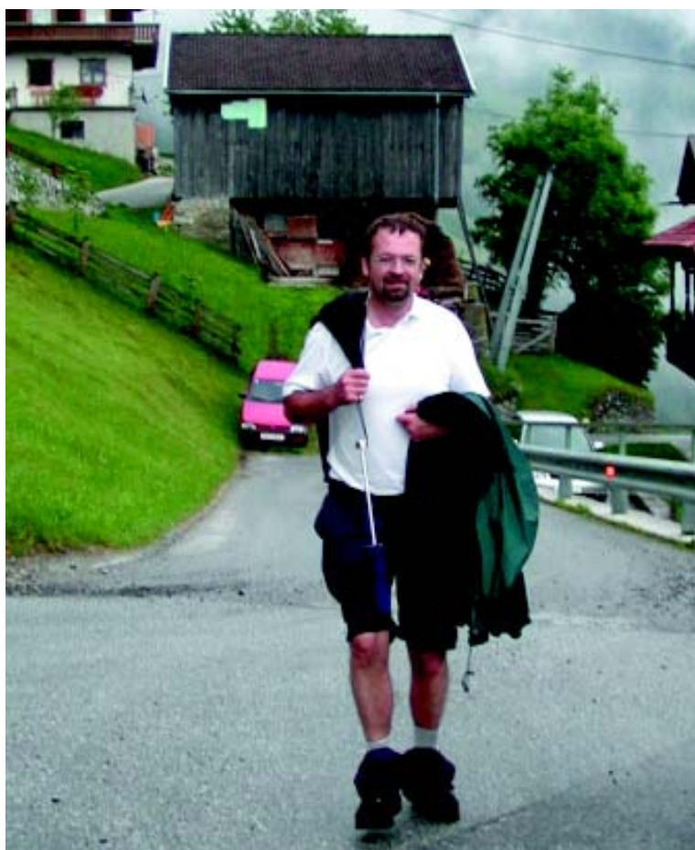
Il presidente a Brandberg (A)