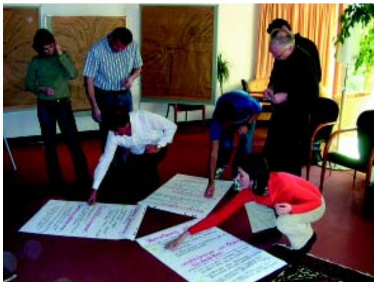
Nel corso del workshop i coordinatori hanno elaborato spunti di soluzione per i problemi esistenti.

Infine si è constatato che uno scambio di questo genere dovrebbe avvenire a scadenze regolari, e che è assolutamente necessario anche come base di lavoro nella Rete.