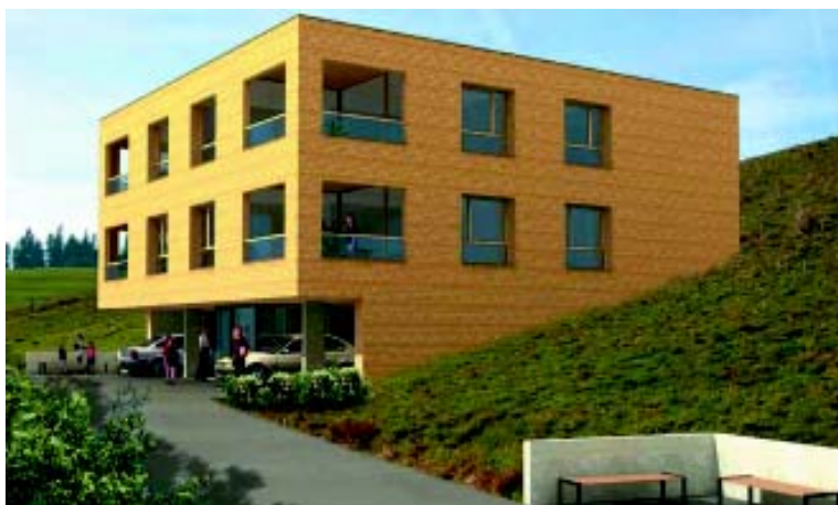
Il progetto vincitore del concorso di architettura legato al progetto „Un nuovo concetto di abitazione“ di Krumbach

Un lotto edificabile di proprietà del comune dovrebbe essere utilizzato nella maniera più intelligente possibile, in termini di pianificazione. Il comune di Krumbach ha voluto dare l'esempio puntando su un nuovo orientamento nella fornitura di spazi abitativi nelle zone rurali. Con questo progetto si è cercato di rispondere alle nuove sfide sociali: alloggi per single, alloggi per anziani e prime abitazioni per i giovani; il tutto all'insegna del motto „costruire risparmiando spazio secondo principi ecologici“.