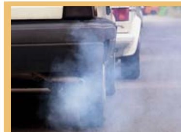
Občine lahko vsakodnevno ravnanje v vlogi potrošnika spremenijo skupaj s svojimi prebivalci.

Pri vseh navedenih dejavnostih imajo pomembno vlogo prav lokalne skupnosti, saj lahko načrtno in učinkovito razširjajo informacije, prebivalce podpirajo z izvajanjem ustreznih ukrepov in tako prebivalstvo opozarjajo na pereče probleme.