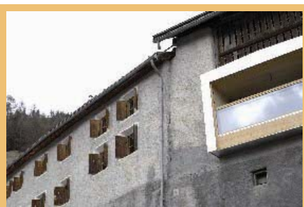
Pročelje obnovljenega hotela Piz Tschütta v švicarskem kraju Vnà