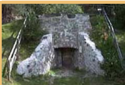
Pred propadom ohranjen običaj, ki ga je leta 1988 v življenje priklicala Società d'Util public.

Junijski tedni gozdov naj bi v Sentu postali tisti dogodek, ki naj bi združeval mlade in stare, domačine in obiskovalce. K zanimivostim kraja je treba prišteti staro rokodelsko dejavnost – oglarstvo, apnenico, leseno vzpenjačo in kiparski simpozij. Obiskovalci imajo priložnost, da spoznajo najrazličnejše sodobne in stare poklice, povezane z lesom. Poleg gradnje ogenice in obiska apnenice in vzpenjače so na programu prireditve tudi predavanja o različnih temah. V tem času bodo v gostinskih lokalih v krajih Sent in Sur En ponujali "oglarke in drvarske specialitete", na prizorišču, kjer se bo odvijal dogodek v celoti, pa bodo potekale številne prireditve ob glasbeni spremljavi.