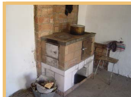
Zaradi gradnje nove peči in izolacije tal je mogoče stroške za energijo posameznega gospodinjstva zmanjšati za 50 %.

Ker so vsi ti rezultati razveseljivi, obenem pa podporo potrebuje še mnogo gospodinjstev, je italijanska občina Massello začela zbirati prispevke, s katerimi bo v letošnjem letu (2008) podprla izvajanje tega projekta. Pri akciji bodo ponovno sodelovali prebivalci avstrijskega Mädra. Seveda se razume, da so pri zbiranju prispevkov dobrodošle tudi druge občine, ki so članice Omrežja občin “Povezanost v Alpah“.