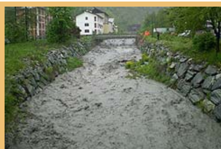
Fortunatamente, durante le alluvioni in Piemonte, non ci sono stati feriti né a Bardonecchia (nella fotografia) né a Massello.

Nei giorni 28 e 29 maggio scorsi le vallate alpine piemontesi sono state interessate da copiose piogge (in alcune località oltre 180 mm in 12 ore) che hanno dato seguito ad allagamenti e fenomeni franosi. In particolare sono state colpite la Valle Pellice (dove purtroppo a causa di una frana che ha travolto una casa ci sono state 4 vittime), la Valle Chisone e la Valle Susa.