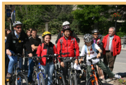
Il segnale di partenza per SuperAlp! è stato dato a Argentière-la-Bessée/F al termine della Settimana alpina.

Ulteriori informazioni: http://www.alpenkonvention.org (de/fr/it/sl).