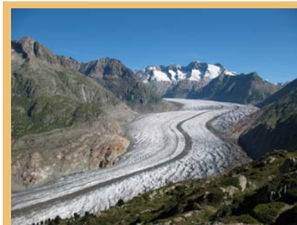
Trajnostni ukrepi proti klimatskim spremembam so pomembna zahteva tega trenutka.

Za podrobnejše informacije in obrazec za udeležbo kliknite na www.cipra.org/cc.alps (de/fr/it/sl/en)