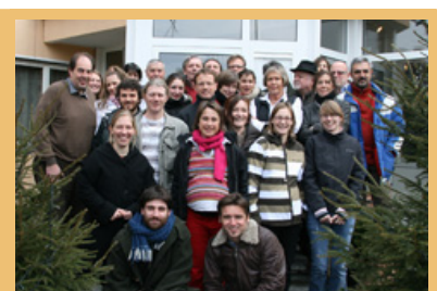
À Balzers, les réseaux se sont renforcés dans la bonne humeur.