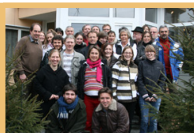
A Balzers i contatti sono stati rafforzati!