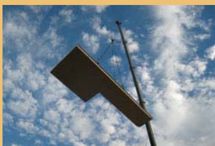
Energijsko učinkovita gradnja – eden od številnih ukrepov za varstvo podnebja.

„Mi smo podnebjje“ ali „Podnebjje – naša skupna odgovornost“: slogani, ki jih lahko vidimo na vsakem vogalu in preberemo v vsaki reviji o življenjskem slogu. S podnebjem kot eno ključnih tem se danes ukvarjajo številni akterji tudi v Alpah, kjer še posebno občutijo vplive podnebnih sprememb. Žal pa se sprejemajo tudi ukrepi, ki načelu trajnostnega razvoja in varstvu narave nasprotujejo.