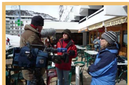
Kratek posvet pred začetkom snemanja, Puy-Saint-Vincent/F

Infos: http://www.alpenallianz.org/en/projects/dynalp2/approved-projects/417/ (fr/en)