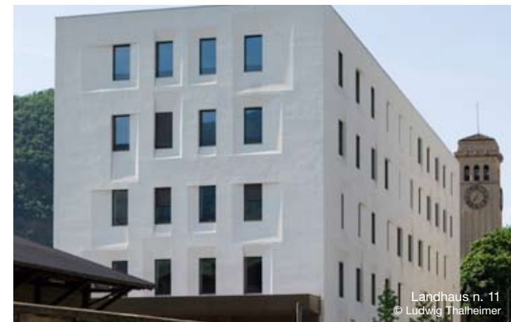
Landhaus n. 11