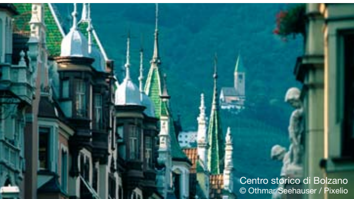
Centro storico di Bolzano

La CIPRA, Commissione Internazionale per la Protezione delle Alpi, organizza da anni, nell'ambito del progetto «climalp», escursioni e seminari sul tema dell'efficienza energetica nell'edilizia. Con il progetto «cc.alps - Cambiamento climatico: pensare al di là del proprio naso» la CIPRA contribuisce a fare in modo che gli interventi climatici siano in armonia con il principio dello sviluppo sostenibile.