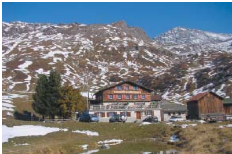
V Suru je doma eno najlepših mokrišč v Švici

Vas Romoos leži sredi idiličnega gričevja v Unescovem rezervatu Entlebuch ter daleč stran od velikih prometnih osi ponuja mir in pestrost naravne krajine. Turistična ponudba Romoosa, ki je sicer manjšega obsega, a zato kakovostna, temelji na teh virih. Ideja o Romoosu kot družinski vasi je nastala z namenom, da bi zlasti v kmetijstvu razširili možnosti dodatnega zaslužka. Projekt naj bi s privlačno ponudbo za otroke in družine pripomogel izkoristiti prednosti, ki jih ima Romoos. Zaščitni znak projekta je igri namenjen krajinski park, ki je trenutno še v fazi načrtovanja. Ko bo projekt uresničen, bodo v njem ob igri lahko družinske počitnice preživljali „mali in veliki“ gostje.