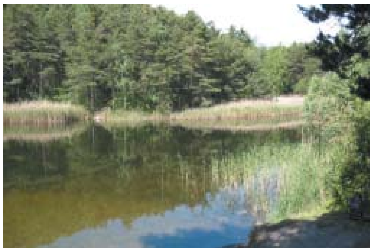
Pfyngski ribnik sredi Pfynges, življenjskega in doživljajskega prostora

Omenjene tri regije so prevzele vlogo spodbujevalcev lokalnega razvoja, ki delujejo v okviru pristojnosti zakona o gorskih območjih. Občine v teh treh regijah kakor tudi v drugih regijah kantona doživljajo proces združevanja, ki ne vključuje le manjših občin, temveč tudi mestna središča. V našem primeru mesto Lugano, ki bo od aprila 2004 postalo del novega Lugana, potrebuje vedno več površin. V tem smislu bodo v okviru projekta ovrednotene obstoječe možnosti za razvoj posameznega kraja in dane na razpolago različnim uporabnikom. Pri tem ni v ospredju mesto, temveč gorska območja. Eden od osrednjih dejavnikov projekta bo kostanj, drevo, ki