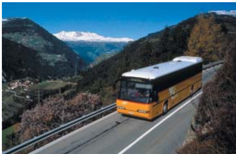
Javni primestni promet ima v dolini Albule pomembno vlogo

Albulaska dolina je bila leta 2002 izbrana tudi za