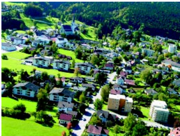
Občina Frastanz želi z zasnovno krajinskega razvoja ohraniti pestrost domače krajine.

V načrtu sta popis osnovnih dokumentov, vzpostavitev baze podatkov, sodelovanje na regionalni ravni s sosednjo občino Nenzing (ki tudi sodeluje pri projektu DYNALP), skupno delovanje, izdelava kataloga ukrepov, priprava projekta varstva krajine ter tematske poti „Rože in suhi travniki.“