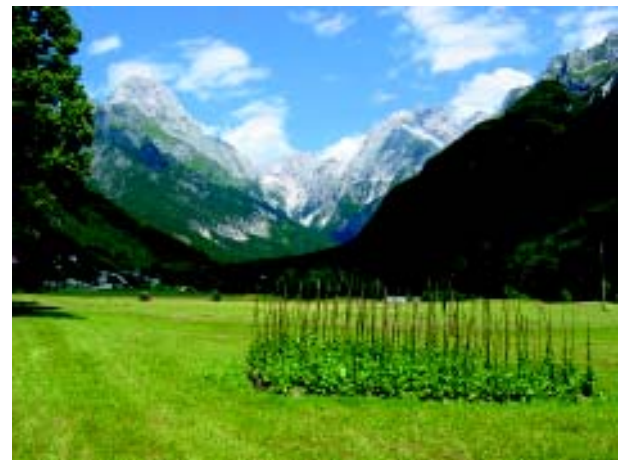
Alpski teden bo septembra letos v Sloveniji.